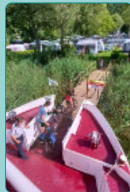
Bequemer Zustieg auch mit dem Rad dank Bugeinstieg

Heute genießen, ohne auf morgen zu vergessen: Wir fahren mit CO 2 -freiem GTL Fuel. Für ein besseres morgen.